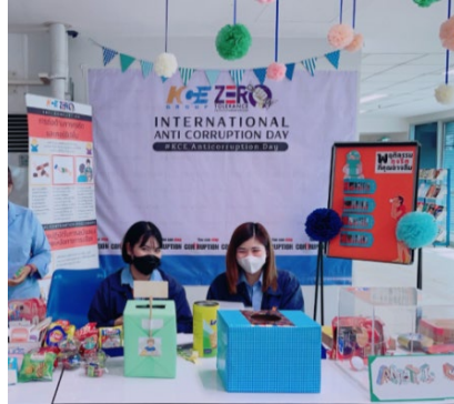
โครงการเชิญชวนคู่ค้าเข้าร่วมโครงการแนวร่วมปฏิบัติของภาคเอกชนไทยในการต่อต้านการทุจริตคอร์รัปชัน (Private Sector Collective Action Against Corruption : CAC)

เป้าหมาย : KCE มีเป้าหมายในการสนับสนุนและเชิญชวนให้บริษัทคู่ค้าเข้าประกาศเจตนารมย์กับ CAC มากกว่า 10 บริษัท ภายในปี 2566 ซึ่งบริษัทเหล่านี้มีปริมาณการซื้อขายถึง 93% ของบริษัทคู่ค้าที่สนใจเข้าร่วมโครงการ